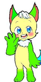
学校マスコット りょういち