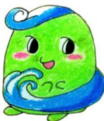
学校マスコット Seiちゃん